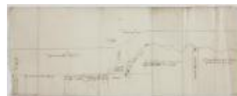
Schetsmatige voorstelling van eigendommen langs de Schelde (K 462)