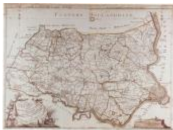
J.B. de Bouge, Carte Topographique du Pays de Waes (K 373)