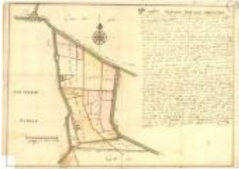
Perceelkaart van de regio Arenbergpolder (K 588)