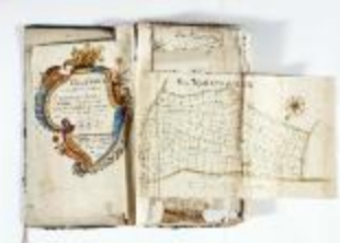
Kaartboek Stekene (KOKW Kaartboek Stekene Vergouwen)