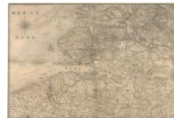
Kaart van Zeeland en de Scheldemonding (Zelande_Escaut A4)