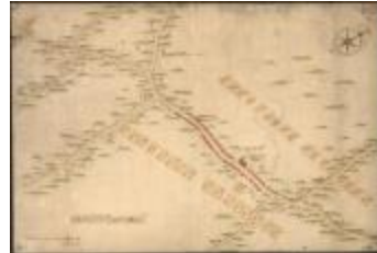
Oorlogskaart: Stekene (Stekene_dorp A4 248/257)