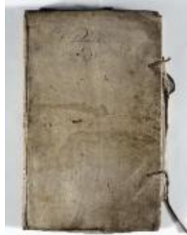
Kaartboek Sint-Pauwels (KOKW Kaartboek Sint-Pauwels Maes)