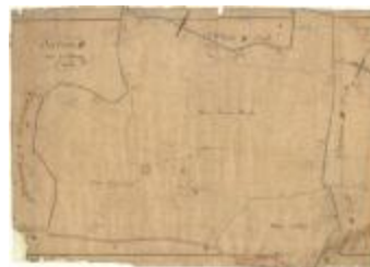
Kadastrale kaart van Beveren (Beveren_SectionD_3eFeuille)