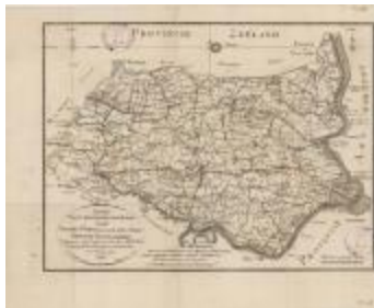
Overzichtskaart van district Sint-Niklaas (K 471)