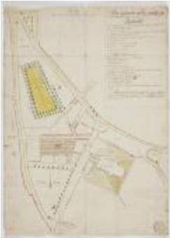
De markt en het centrum van Sint-Niklaas (K 508)