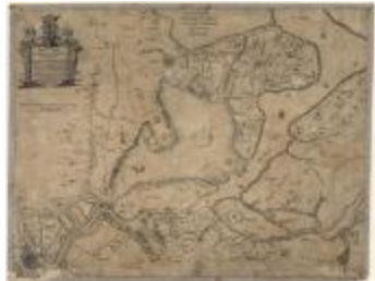
Description de Santvliet, la Rivière Schelde et Pais de Hulst (Santvliet-Hulst A4 253/257)