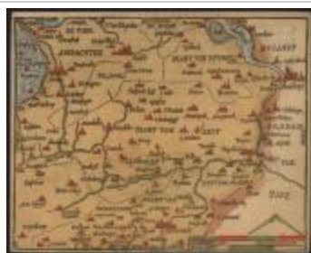
De Charte van Vlaenderen (Het Land van Waas_Heyns A4)