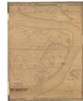
Popp-kaart: Zwijndrecht (Zwijndrecht_Popp A4)