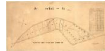
Perceelkaart van het Paardenschor (Paarden schorre A4)