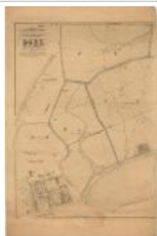
Popp-kaart: Atlas cadastral de Belgique - Commune de DOEL (Doel_Popp A4)