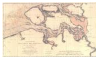
Carte réduite des cotes des Pays-Bas (Côtes des Pays-Bas A4)