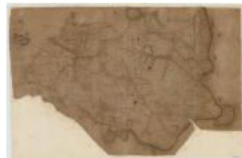
Fricx, Carte très particulière du Pays de Waes (Tres particuliere)