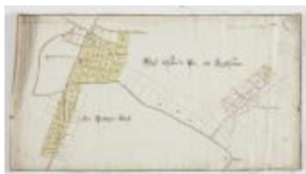
Wijkaart van Haasdonk, omgeving Ropstraat en Bergstraat (K 476)