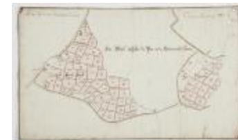
Wijkaart van Haasdonk, omgeving Perstraat en Botermelkstraat (K 475)