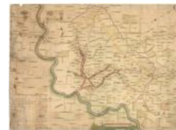
Oorlogskaart, Lokeren (K 483)