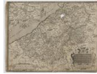
Ortelius, Kaart van Vlaanderen (K 559)