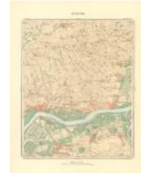
Dépot de la Guerre: Tamise (Tamise A4 227/257)