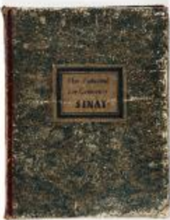
Plan Cadastral der Gemeente Sinay (KOKW Plan Cadastral Sinaai)