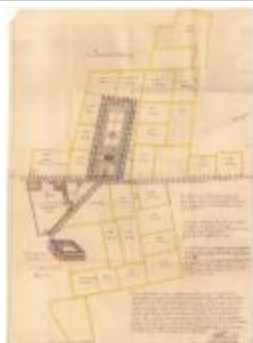
Wijkkaart van wijken Kloosterland en Beenaert (Cloosterlant Wijk A4 256/257)