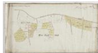
Figuratieve Caerte van de Cabbeljau Thiende (K 474)