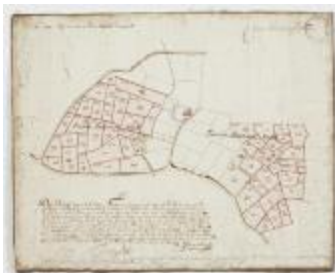
Figuratieve Caerte van de Cabbeljau Thiende (K 473)