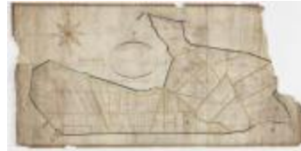
Polderkaart van de dijkage van Kallo (K 547)