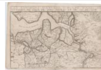
Les environs d'Anvers, d'Hulst, d'Axel, de Santvliet, de Lillo, de Saint-Nicolas et du Sas de Gand (Danet)