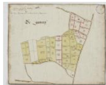
Wijkaart van Haasdonk, omgeving De Gavers (K 478)