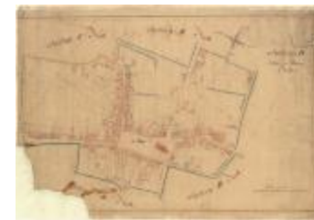
Kadastrale kaart van Beveren (Beveren_SectionD_8eFeuille)