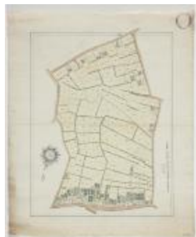
Wijkaart Bormtmeulenakker, Stekene (K 452)