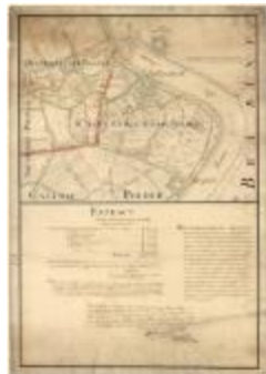
Polders van Kallo, Sint-Anna Ketenisse, Doel en Arenberg (Liefkenshoek A4)