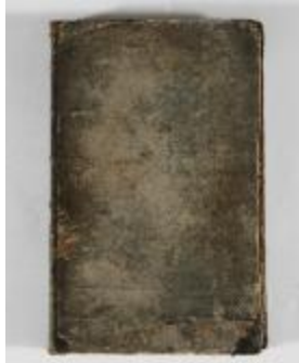
Kaartboek Sint-Gillis-Waas (KOKW Kaartboek Sint-Gillis-Waas Du Caju)