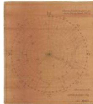
Oriëntering vanop de toren van Temse (Oriëntering_toren_Temsche A4)