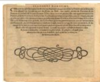
Het Land van Waas_Heyns_Bis A4.tif (Het Land van Waas_Heyns_Bis A4)