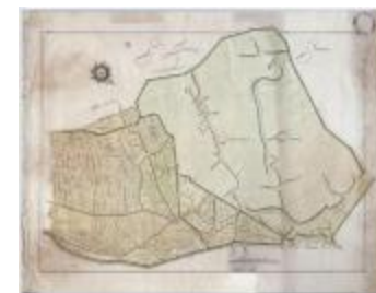
Wijkaart Stekene: Hellestraat-Kapellebrug (K 463)