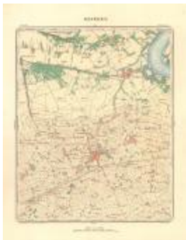
Dépôt de la Guerre: Beveren (Beveren A4)