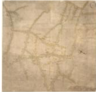
Oorlogskaart, Sint-Gillis-Waas (K 542)