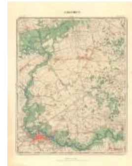
Dépot de la Guerre: Lokeren (Lokeren A4)