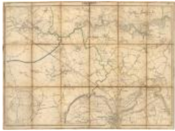
Vandermaelen: Lokeren en Dendermonde (Lokeren_Termonde A4)