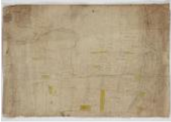
Digironde november (_88D0885)