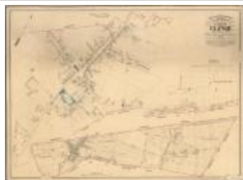
Popp-kaart: Clinge (Clinge_Popp A4)