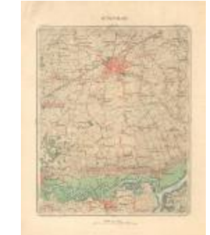
Dépot de la Guerre, Saint-Nicolas (St- Nicolas A4)