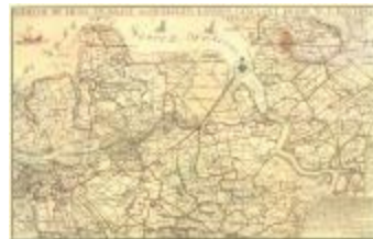
W.T. Hattinga, de Schelde bij Lillo en naast aangelegen landen (Lillo_Hattinga A4)