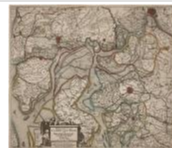
Detail uit Visscher, Nieuwe kaerte van 't Landt van Waes (K 291)