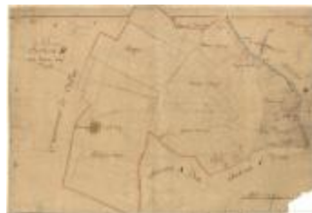
Kadastrale kaart van Beveren (Beveren_SectionB)