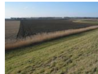
Dijk en polder (p80winter10_0607)