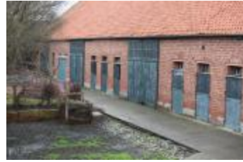
Schuur van de Antoniushoeve (IMG_6424)