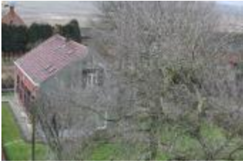
Zicht op de Antoniushoeve (IMG_6421)