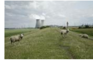
Dijk met zicht op de koeltorens van Doel (_MG_9294)