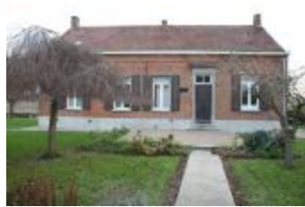
Woonhuis van de Antoniushoeve (IMG_0810)