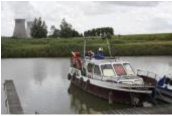
Jachthaven met zicht op de koeltorens van Doel (_MG_0018)