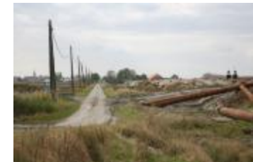
Werken in de polder (IMG_9616)