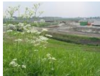
Graafwerken bij de ontpoldering (IMG_0821)