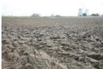
Geploegde akker aan de voet van de koeltorens van Doel (IMG_9619)