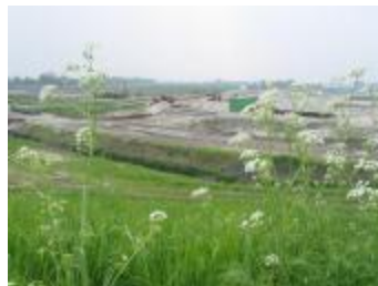
Graafwerken bij de ontpoldering (IMG_0820)