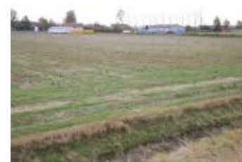
Polderzicht met bewoning (IMG_9625)