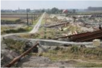
Werken in de polder, nabij de Antoniushoeve (IMG_9602)