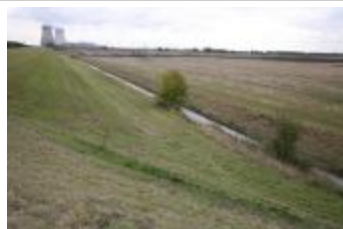
Dijk, koeltorens en polder (IMG_9633)