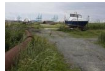
Polder en havenindustrie (_MG_0017)