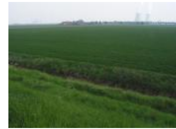
Polderzicht met bewoning en industrie (IMG_0812)