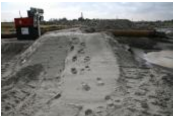
Opgespoten zand (IMG_9610)