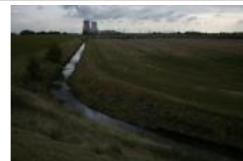
Polder en koeltorens bij avond (IMG_9636)