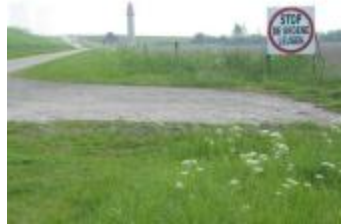
Protestbord tegen de ontpoldering (IMG_0814)