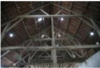
Gebinte van de monumentale schuur van de Antoniushoeve (IMG_0758)