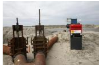
Werken in de polder (IMG_9613)