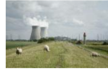
Dijk met zicht op de koeltorens van Doel (IMG_9293)