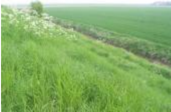
Dijk en polder (IMG_0813)