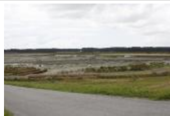
Zicht op de werken in de Prosperpolder (_MG_0015)