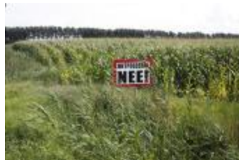
Protestbord tegen de ontpoldering (_MG_0034)