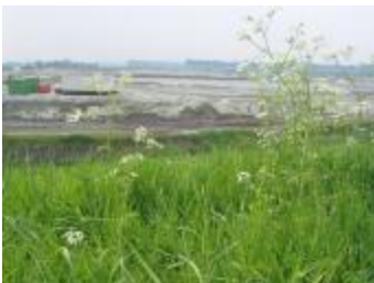
Graafwerken bij de ontpoldering (IMG_0819)