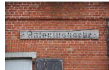
Geveldetail, Antoniushoeve (IMG_6408)