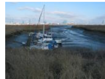
Jachthaven bij laag water (p80winter14_0615)