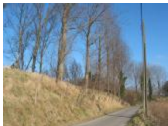
Pad langs de dijk (p80winter12_0612)