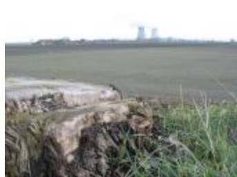
Polderzicht met koeltorens (p80winter4_0595)