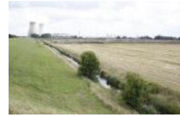
Polderzicht met koeltorens (_MG_0022)