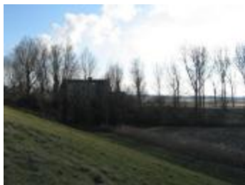
Dijk, polder en bewoning (p80winter11_0610)