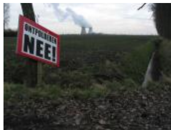
Protestbord tegen de ontpoldering (p80winter8_0605)