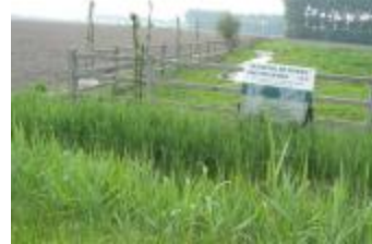
Protestbord tegen de ontpoldering (IMG_0815)