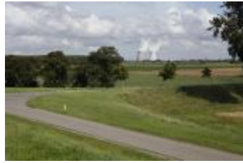
Dijk met zicht op de koeltorens van Doel (_MG_0041)