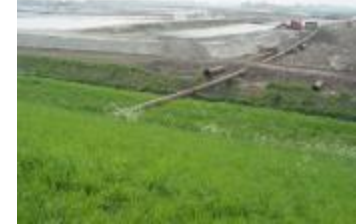
Graafwerken bij de ontpoldering en havenuitbreiding (IMG_0818)