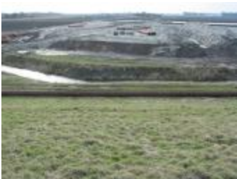
Graafwerken in de polder (p80winter3_0592)