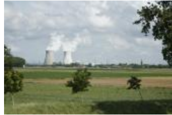
De polder met zicht op de koeltorens van Doel (_MG_9314)