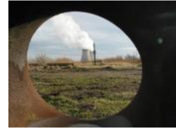
De koeltorens van Doel (p80winter2_0588)