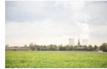
Kerk en koeltorens (IMG_9648)