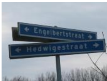
Straatnaamborden Engelbertstraat en Hedwigestraat (p80winter7_0600)