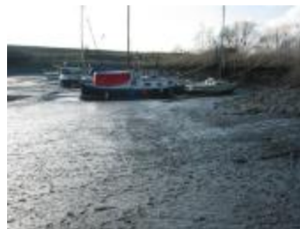
Jachthaven bij laag water (p80winter13_0613)