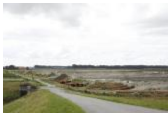
Zicht op de werken in de Prosperpolder (_MG_0014)