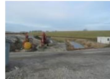
Werken in de polder (p80winter6_0598)