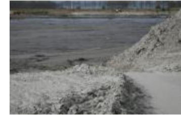
Opgespoten zand (IMG_9608)