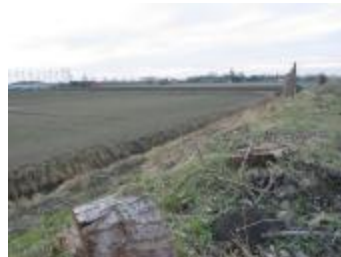
Dijk en polder (p80winter5_0597)