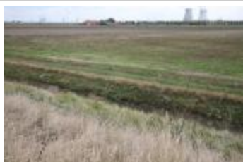
Polderzicht met havenindustrie (IMG_9626)